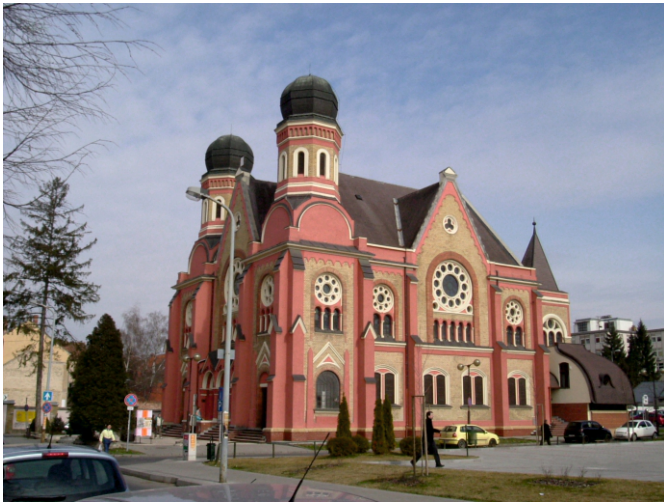
VÁROSI HANGVERSENYTEREM-ÉS KIÁLLÍTÓTEREM ZALAEGERSZEG